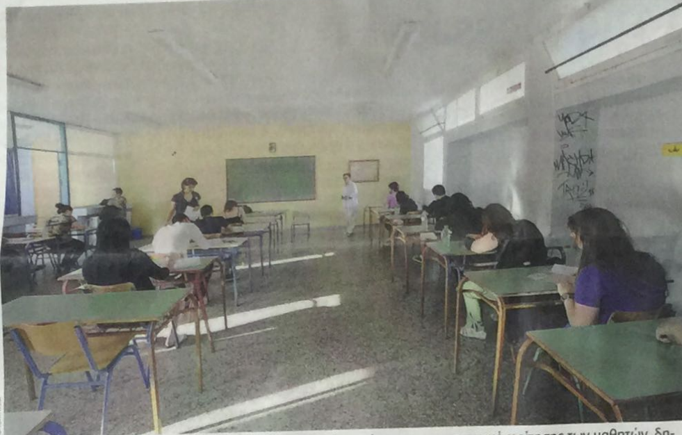
Ο σύλλογος διδασκόντων του ιδιωτικού σχολείου θα κάνει μόνο τον χαρακτηρισμό φοίτησης των μαθητών, δηλαδή τον έλεγχο απουσιών αλλά και της διαγωγής των μαθητών.

Σήμερα ο Σύνδεσμος Ιδρυτών Ελληνικών Ιδιωτικών Εκπαιδευτηρίων φιλοξενεί το ετήσιο συνέδριο του Ευρωπαϊκού Συμβουλίου των Εθνικών Συνδέσμων Ιδιωτικών και Ανεξάρτητων Σχολείων - ECNAIS. Το φετινό συνέδριο έχει θέμα «Η ενδυνάμωση της κοινωνίας μέσα από την ελευθερία στην εκπαίδευση», και θα συμμετάσχουν εκπρόσωποι από σχολεία και φορείς ιδιωτικής εκπαίδευσης από χώρες της Ε.Ε. Πάντως, χθες, η Ομοσπονδία Ιδιωτικών Εκπαιδευτικών (ΟΙΕΛΕ) δημοσιοποίησε έρευνα του Κέντρου Ανάπτυξης Εκπαιδευτικής Πολιτικής (ΚΑΝΕΠ) της ΓΣΕΕ, σύμφωνα με την οποία τα ανεξάρτητα ιδιωτικά σχολεία εκπροσωπούν λιγότερο από το 3% της τυπικής εκπαίδευσης στην Ευρώπη. Στην